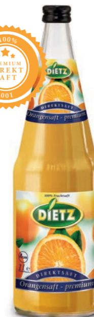
Direktsaft PREMIUM ORANGE