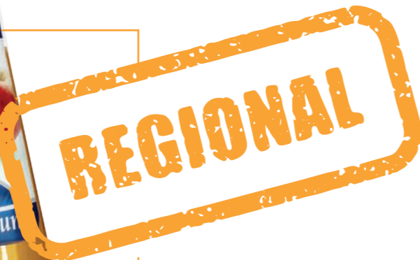
Direktsaft APFEL PREMIUM