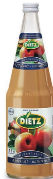
Direktsaft APFEL NATURTRÜB